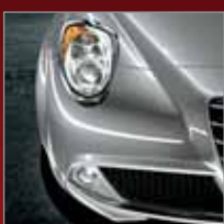
612 Grigio Techno (M)