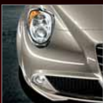
252 Bianco Gardenia (M)