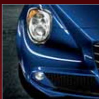
468 Blu Tornado (M)