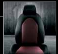
125 Stoffbezug Sprint Schwarz-Rot