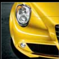
507 Giallo Corsa (E)