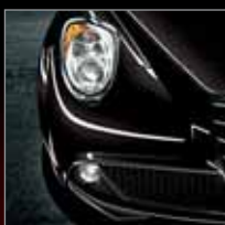
601 Nero (P)