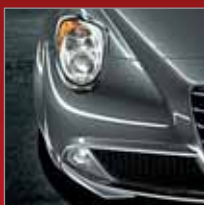
669 Grigio Grafite (M)