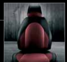
358 Stoffbezug Competizione Schwarz-Rot