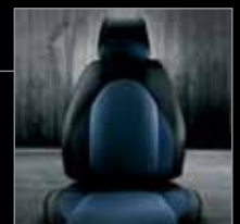
324 Stoffbezug Competizione Schwarz-Blau