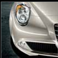
251 Biancospino (E)