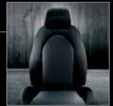
135 Stoffbezug Sprint Schwarz-Grau